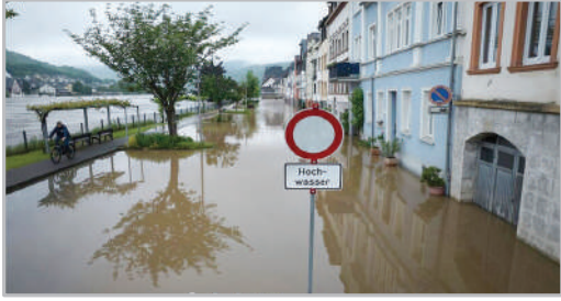
سیل در شهر زل-آلمان