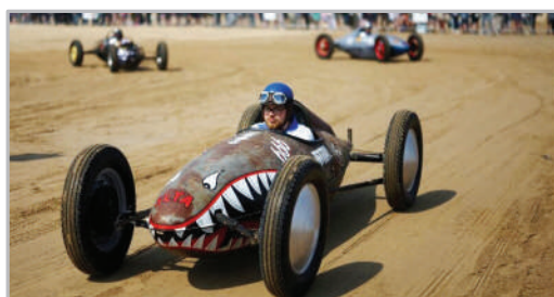
مسابقات اتومبیل‌رانی کلاسیک - انگلیس