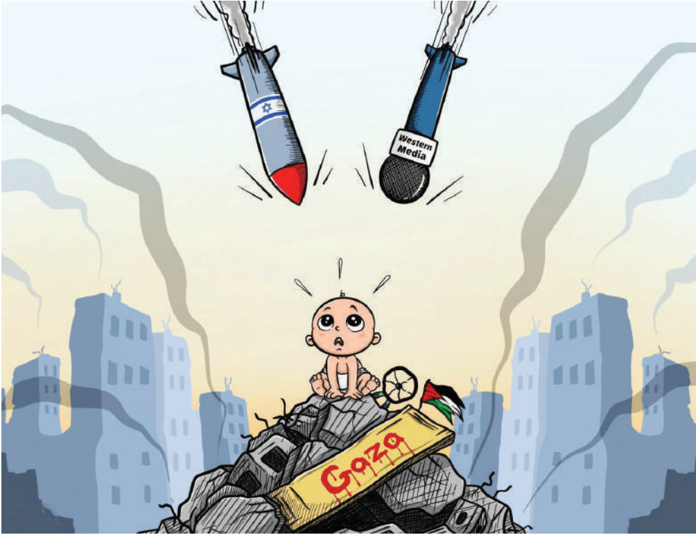
بیماران موشکی و رسانه‌های کودکان غزه