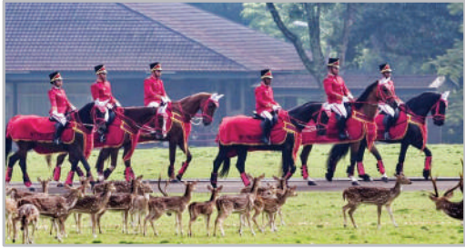
کارند تشریف‌کاخ ریاست جمهوری اندونزی