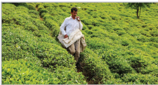
برداشت چای بهره باغات املش - کیلان