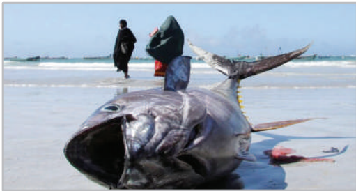
ساحل موگادیشو - سومالی